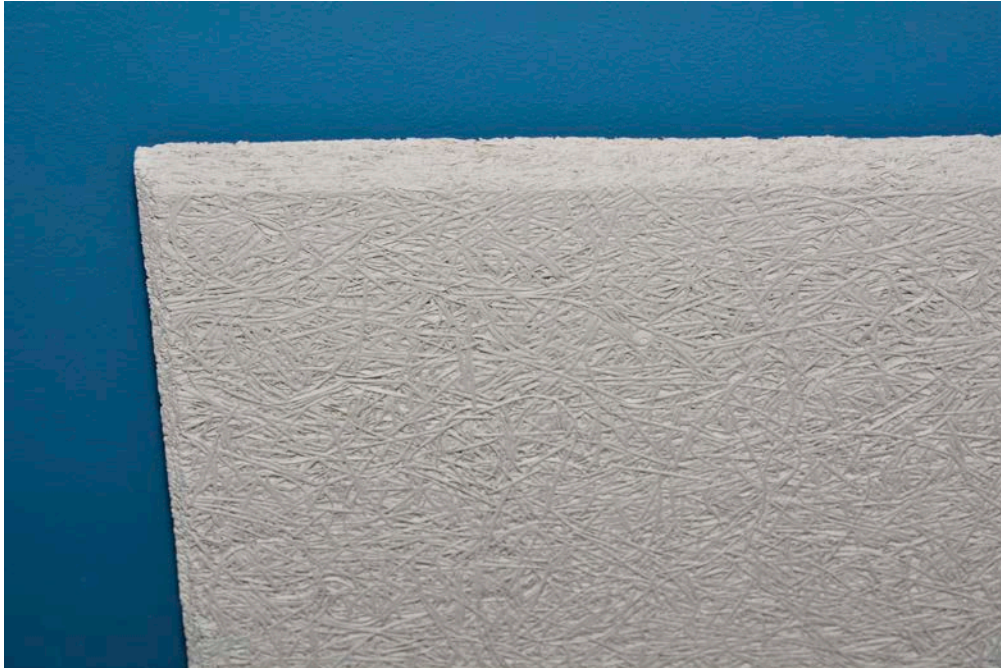
Ansprechende Optik der lichtgrau gespritzten Platten mit der feiner Holzwolestruktur und gefasten Kanten