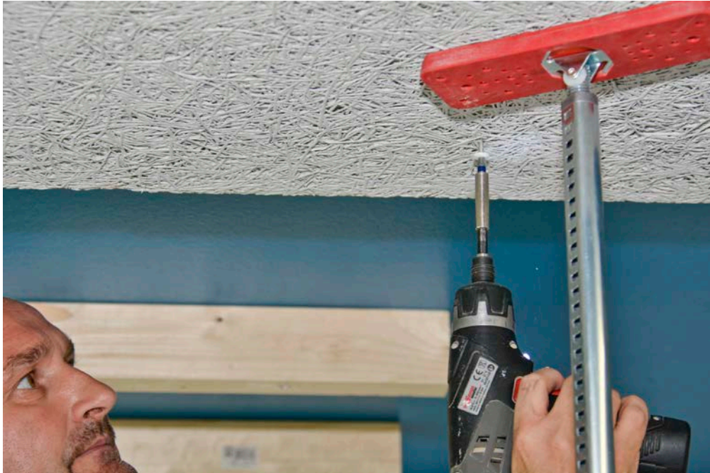
Anschrauben der Holzwolle-Akustikplatten mit Fibro-Akustikschrauben