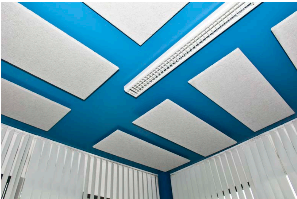
Fertige Deckensegel aus Fibro-Kustik-Platten „fein“ der Marke Fibrolith