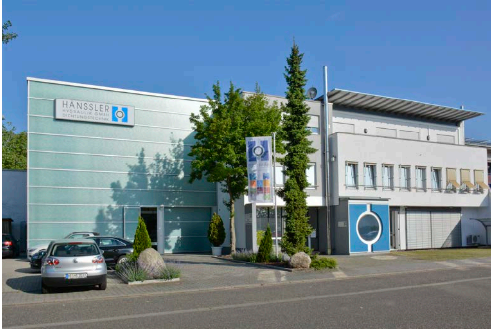
Büro- und Fertigungsgebäude der Firma Häussler Hydraulik GmbH in MA-Friedrichsfeld

Es gibt bereits erste Planungen zur akustischen Verbesserung weiterer Räume mit demselben System.