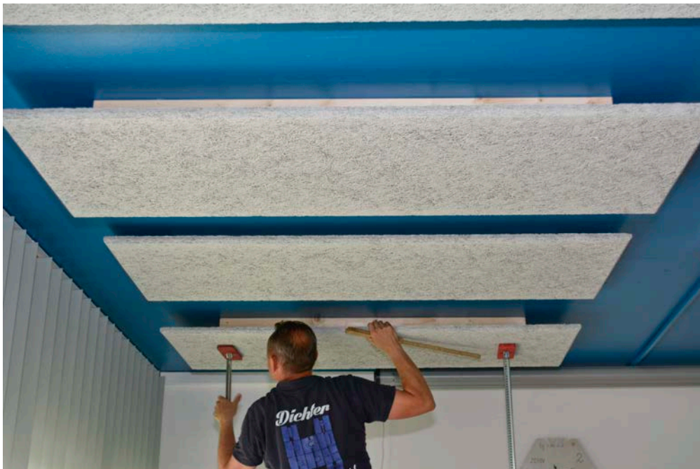
Ausrichten und Fixieren der Akustikplatten mit Montagestützen