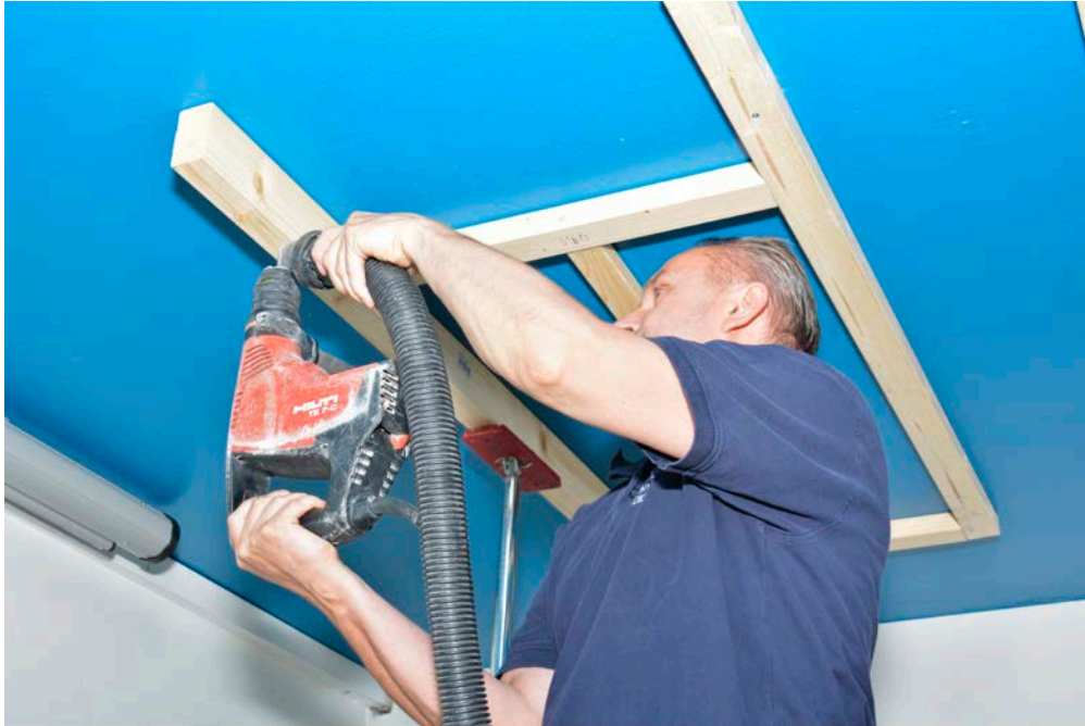
Montage der Kantholz-Plattenträger mit Schlagdübeln und mit Hilfe von selbstgebauten Abstandslehren