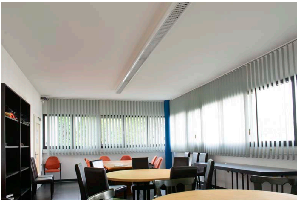
Mitarbeiterkantine und Besprechungsraum der Firma Häussler mit schlechter Raumakustik vor der akustischen Verbesserung mit Fibro-Kustik-Platten