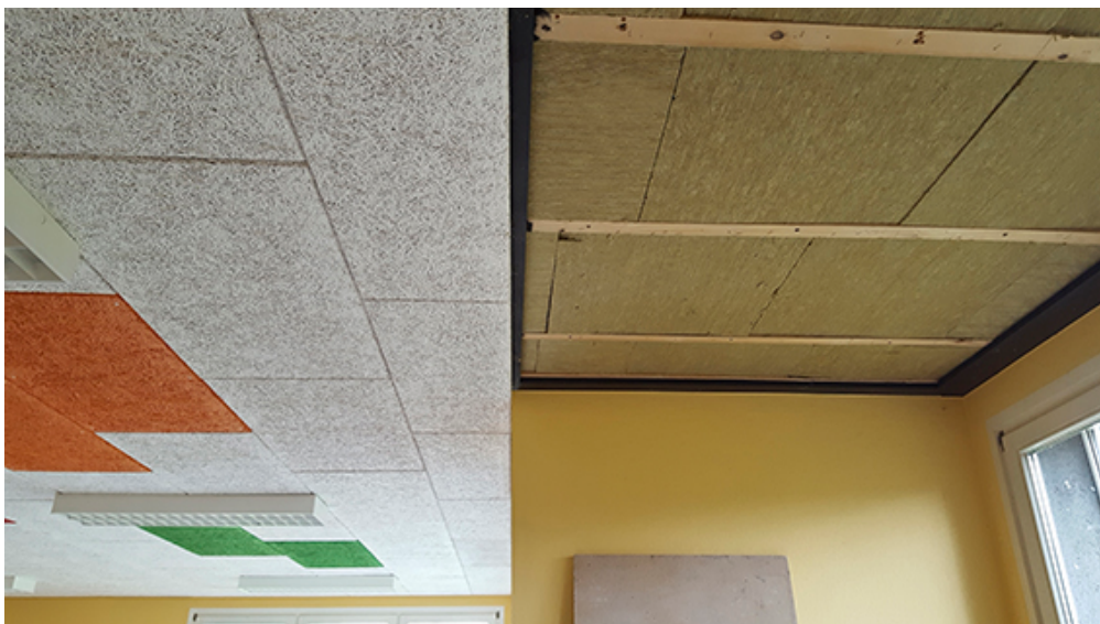
Bild 4 (siehe Ordner Bilder): Rechts: Mit Mineralwolle gefüllte Zwischenräume der vorhandenen Holzunterkonstruktion als zusätzliche Schalldämmung. Links: Fertig montierte Fibro-Kustik Platten