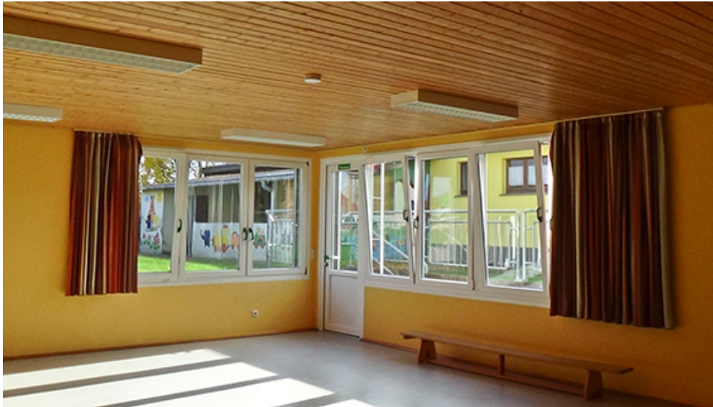
Bild 3 (siehe Ordner Bilder): Alte Holzdecke, die maßgeblich für die schlechte Raumakustik im Kindergartenraum verantwortlich war.