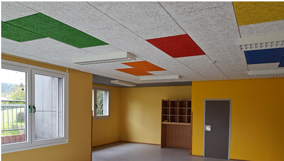
Bild 5b (siehe Ordner Bilder): Neue kunterbunte Akustikdecke in den RAL-Farben der fünf Kindergartengruppen