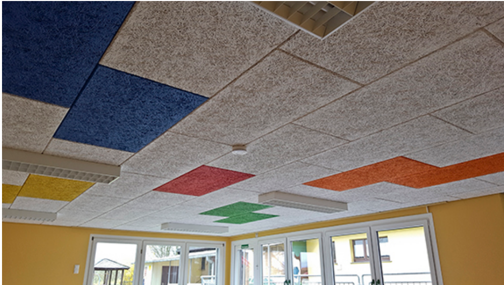
Bild 5a (siehe Ordner Bilder): Neue kunterbunte Akustikdecke in den RAL-Farben der fünf Kindergartengruppen