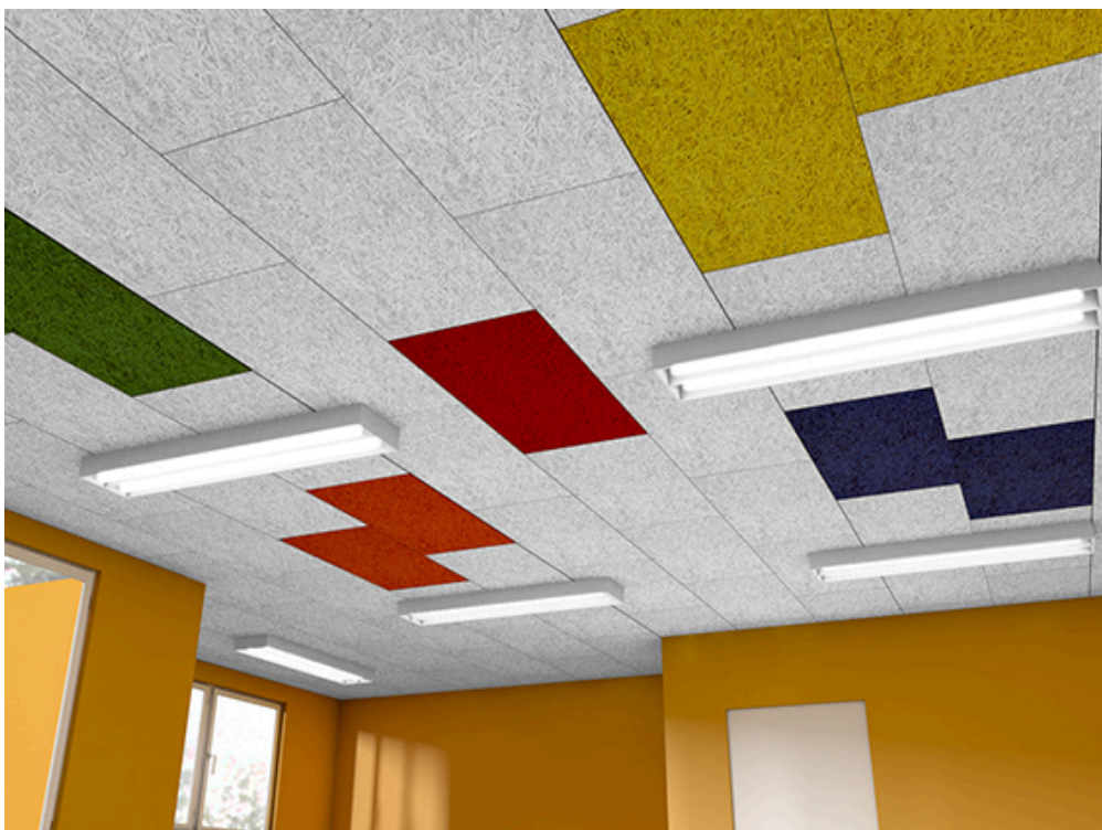
Bild 2b (siehe Ordner Bilder): Nahezu fotorealistischer 3D-Designentwurf der neuen Akustikdecke. "Tetris" lässt grüßen.