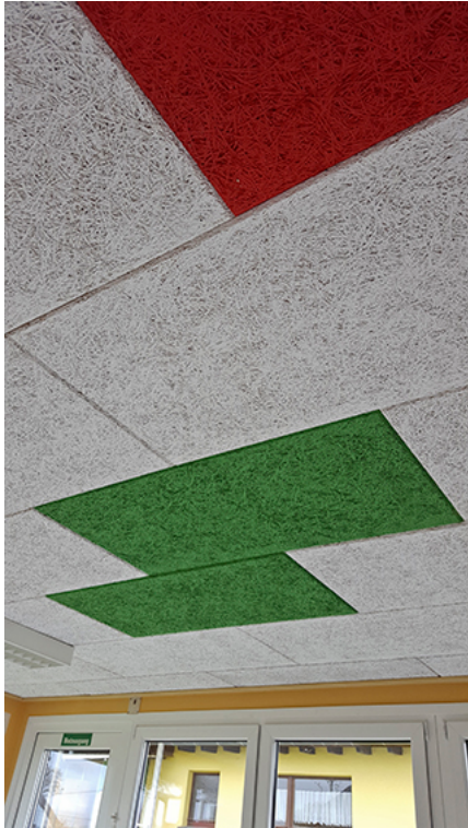
Bild 6 (siehe Ordner Bilder): Ansprechende Deckenoptik mit feiner Holzwollestruktur und gefasteten Kanten