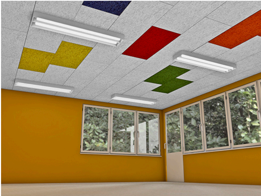
Bild 2a (siehe Ordner Bilder): Nahezu fotorealistischer 3D-Designentwurf der neuen Akustikdecke. "Tetris" lässt grüßen.