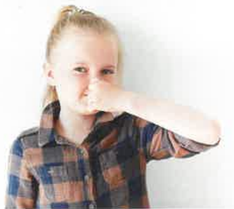
Bild 2. Ausdünstungen aus Möbeln, Teppichen, Spielzeug oder alten Wand- und Deckenverkleidungen können auch in Kindergärten die Qualität der Raumluft beeinträchtigen

Stickoxide (NOX) gelangen durch Emissionen von Fahrzeugen oder Kohlekraftwerken auch in die Raumluft. Was diese Luftverschmutzungen im Freien angeht, unternehmen Politik, Städte und Kommunen gerade größte Anstrengungen, um diese deutlich zu reduzieren.