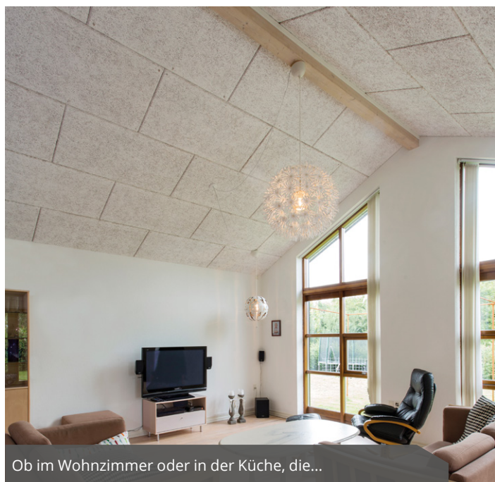
Ob im Wohnzimmer oder in der Küche, die...

Nicht nur die hervorragenden schallabsorbierenden Eigenschaften der Fibro-Kustik Platten überzeugten die Bauherren, sondern auch die Natur-Optik der Akustikplatten.