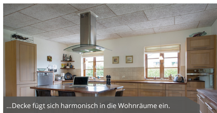
...Decke fügt sich harmonisch in die Wohnräume ein.